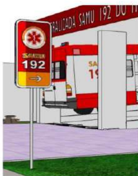
Figura 13 – Exemplo – aplicação de placa.

Meramente ilustrativo.